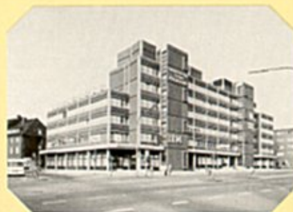
Köln Versicherung, Münster