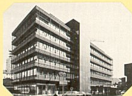
Deutsche Bank, Bielefeld